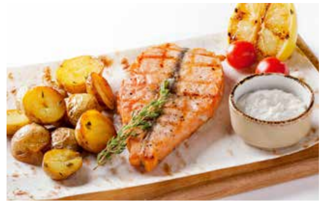
Стейк из семги