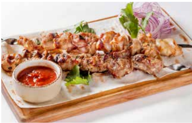
Шашлык из свинины и из филе цыпленка