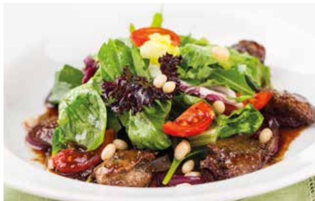
Теплый салат с куриной печенью